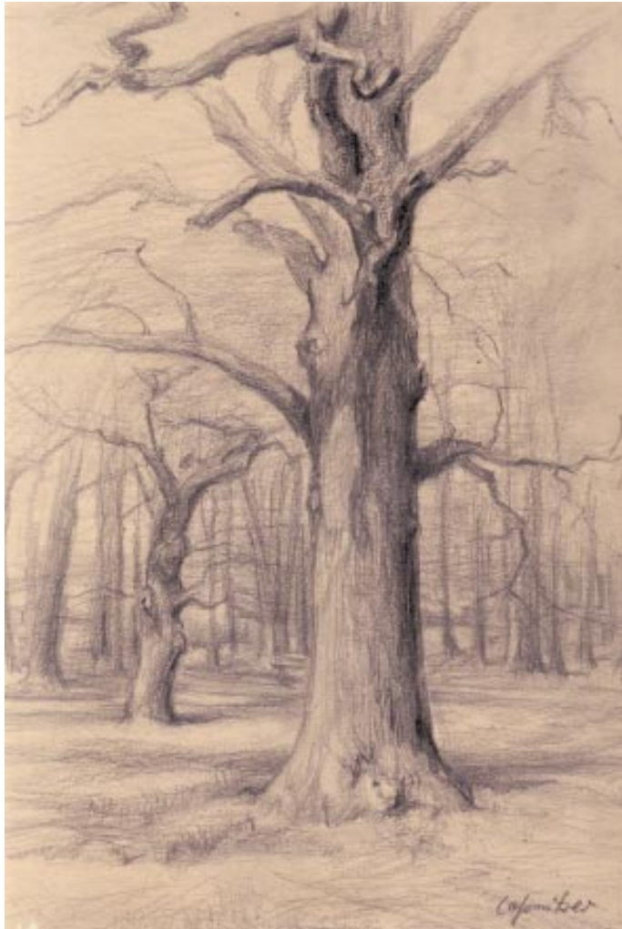
Im großen Garten Bleistiftzeichnung aus der Vorstudienzeit