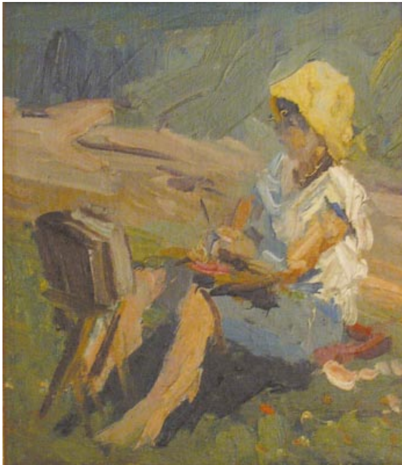
„Maxi mit gelbem Hut“, Öl, Privatbesitz, Frankfurt/Main

Der einzige Grund wonach man strebt, ist zu begreifen, daß man lebt. Das kann ich aber mitnichten. Deshalb muß ich manchmal was dichten...!