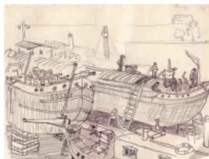
Skizzen von der Werft Laubegast