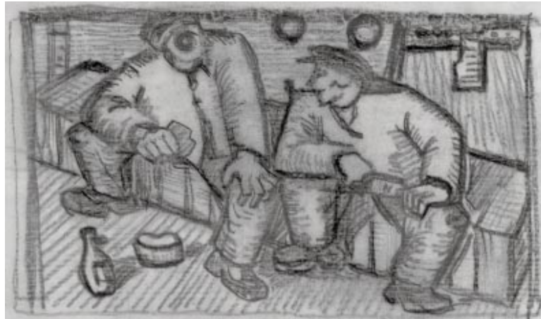
Frühstück - Verschiedene Meinungen (Bleistift, Holzschnitt, 1960)